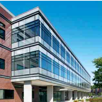
Schüco Aluminium Tür-System ADS 65 HD Schüco Aluminium door system ADS 65 HD

Aluminium Tür-System Aluminium door system